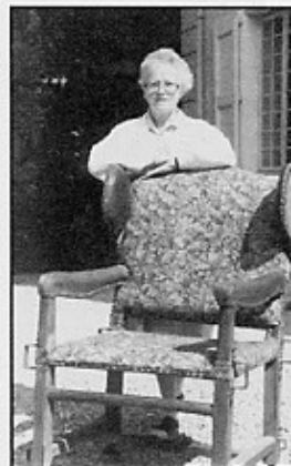
Le fauteuil du Pape. Son passage à Tullins était dû à des circonstances tout à fait particulières.

par la suite, remis au Vatican qui fera don de quelques reliques à la cathédrale de Valence.